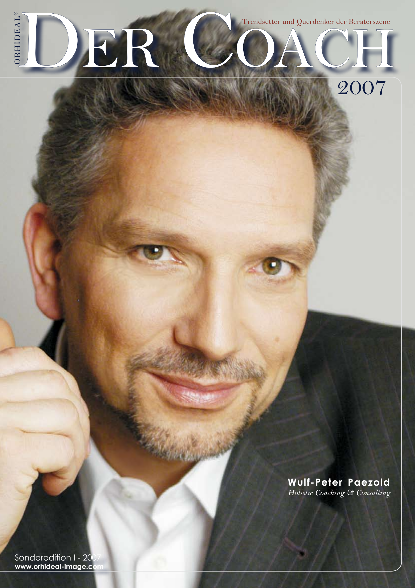
Wulf-Peter Paezold Holistic Coaching & Consulting